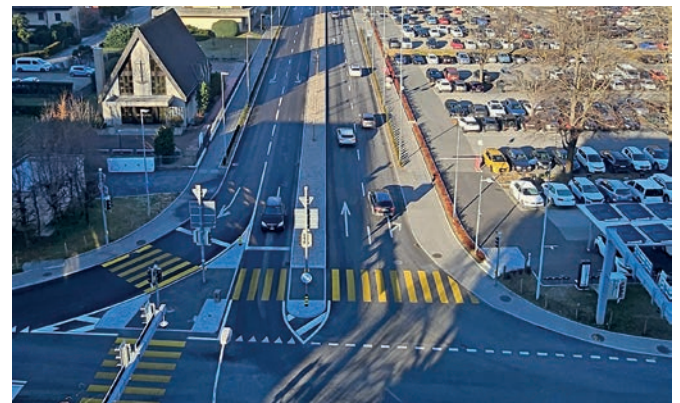
Incrocio di via Tatti con via Zorzi

A partire da mercoledì 5 febbraio 2025 il Semisvincolo di Bellinzona Centro sarà completamente operativo sia in entrata verso sud, sia in uscita da sud.