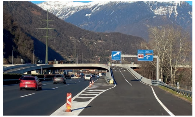
Nuova uscita autostradale da sud