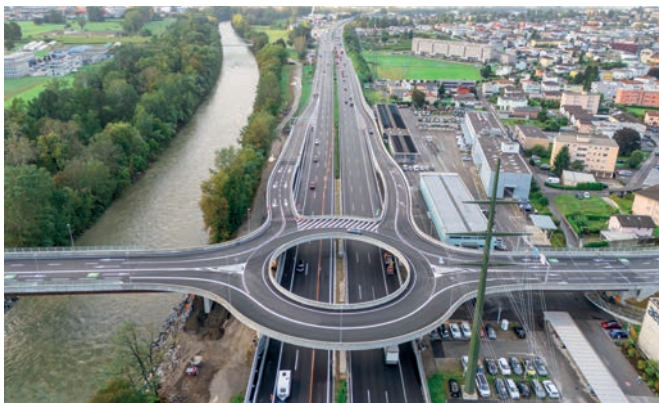
Veduta del Semisvincolo da nord