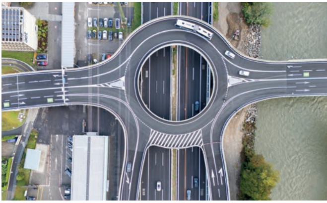
Vista planimetrica del Semisvincolo