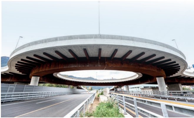
La rotonda sopraelevata del Semisvincolo vista dal basso