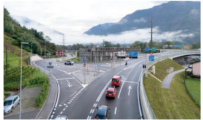
Incrocio Monte Carasso