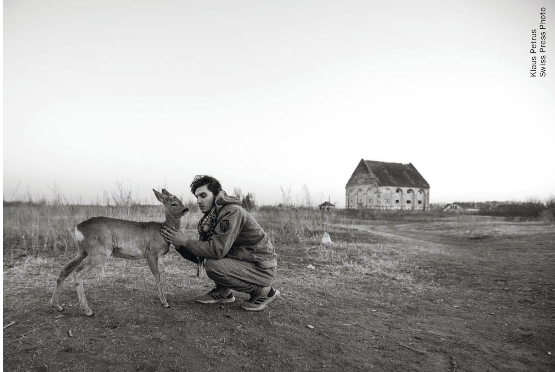
Klaus Petrus Swiss Press Photo

The exhibition travels throughout Switzerland and stops in Zurich, Bern, Prangins and Bellinzona.