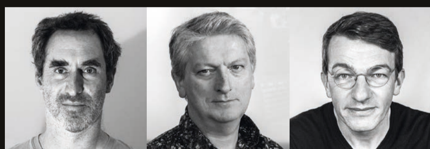
Denis Balibouse 1 er Prix Actualité | Mark Henley 1 er Prix Vie Quotidienne | Gaëtan Bally 1. Preis Schweizer Geschichten