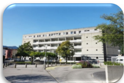
Casa anziani Comunale