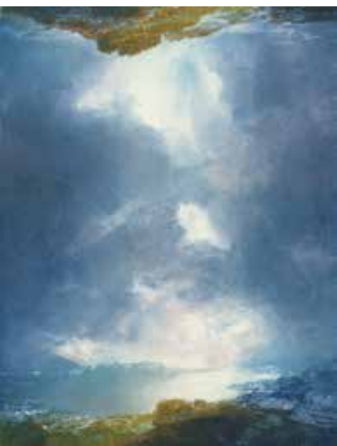
Ciel d'été, 1998 acquatinta, acquaforte, grattage, brunitoio, punta secca, bulino e fotoincisione su carta, 292 x 230 mm Musée Jenisch Vevey - Cabinet cantonal des estampes, Fondation William Cuendet & Atelier de Saint-Prex