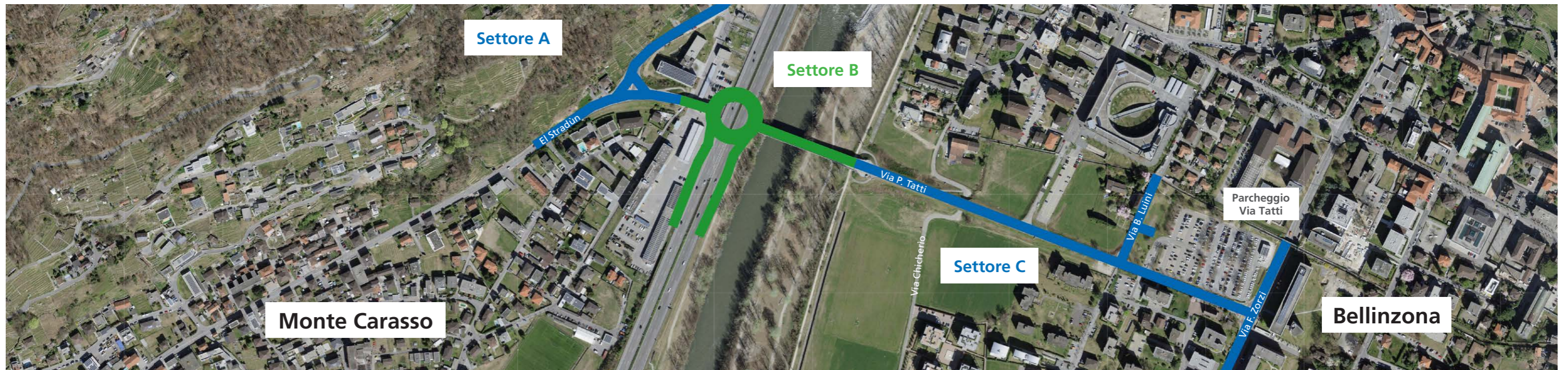
I settori del progetto