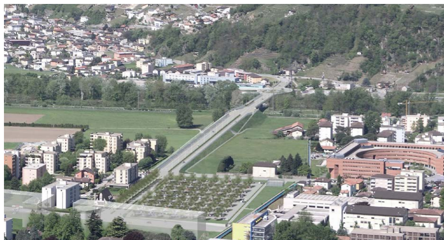
I lavori ai raccordi e al nuovo ponte stradale con vista sui nuovi ripari fonici

Il progetto è stato elaborato con l'obiettivo di gestire meglio il traffico individuale privato in entrata e in uscita dalla città e per poter rendere più efficiente quello pubblico – anch'esso spesso incolonnato sulle strade che attraversano le zone residenziali di Camorino, Giubiasco, delle Semine, così come di Sementina e Monte Carasso – come pure per chi, evitando lo svincolo a sud, utilizza quello a nord. A beneficiarne sarà in primis la qualità di vita di chi abita a margine delle strade che verranno sgravate, ma anche di chi potrà così disporre di una nuova infrastruttura.