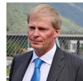
Claudio Zali, Consigliere di Stato e Direttore del Dipartimento del territorio

Con questo sistema costituito da più opere pure a favore della mobilità ciclabile e pubblica, si concretizza anche il terzo pilastro su cui poggia il Piano dei trasporti del Bellinzonese: un massiccio potenziamento del trasporto pubblico (realizzato nel 2014 e completato nel 2020 parallelamente all'apertura della galleria di base del Monte Ceneri), il completamento della rete ciclabile regionale (con molte opere già realizzate e altre in via di costruzione) e, appunto, una migliore gestione del traffico in entrata e uscita dall'agglomerato, sfruttando l'autostrada come circonvallazione, nel segno di una concezione intermodale della mobilità. La mia gratitudine, oltre a chi si è adoperato nella progettazione delle opere e a chi è ora chiamato a realizzarle, va alla popolazione che ha atteso sinora e nel prossimo futuro si vedrà confrontata con il cantiere di ciò che, quando terminato, segnerà per tanti cittadini e cittadine un sostanziale miglioramento della situazione attuale.