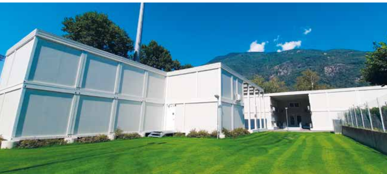
I prefabbricati situati nei pressi delle Scuole Nord accoglieranno i quasi 150 allievi della scuola dell'infanzia Palasio dopo l'allagamento.

La scuola non è però fatta solo di banchi e di lezioni. Vi sono anche momenti formativi che si svolgono fuori dalla sede scolastica, come ad esempio le settimane bianche e quelle verdi. Entrambe le attività verranno proposte - dopo oltre un anno di stop forzato a causa della pandemia - con una formula in parte diversa. Nel caso delle uscite sugli sci, per gli allievi di IV elementare è prevista una settimana bianca con rientro a domicilio; rimane invece invariata la settimana verde per gli allievi di V. Al di fuori degli orari scolastici si svolgono an-