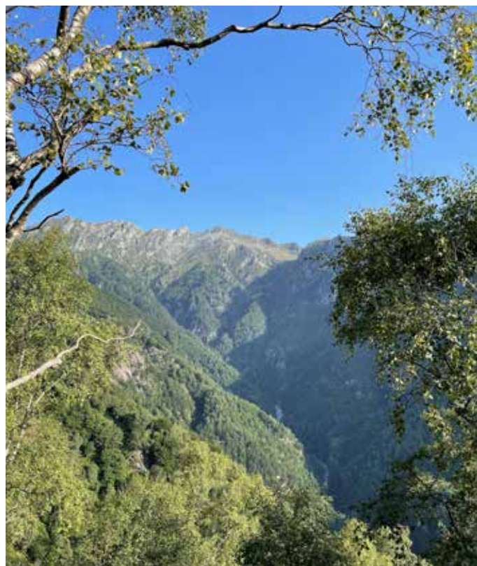
Il documento approfondisce una serie di temi relativi alla sicurezza e alla valorizzazione di queste aree naturali.

Il Piano di gestione forestale dei quartieri di Sementina e Gudo sarà in pubblicazione dal 27 settembre al 26 ottobre 2021 in ossequio alla legislazione cantonale sulle foreste. In questo periodo potrà essere consultato, su appuntamento, contattando il numero di telefono 091/814.03.71. L'incarto è depositato presso l'Ufficio forestale del 9° Circondario, Via alla Sertà 7, 6517 Arbedo-Castione. Eventuali osservazioni sono da inviare alla Sezione forestale cantonale, Bellinzona, in forma scritta, entro un termine di 15 giorni dalla scadenza della pubblicazione.