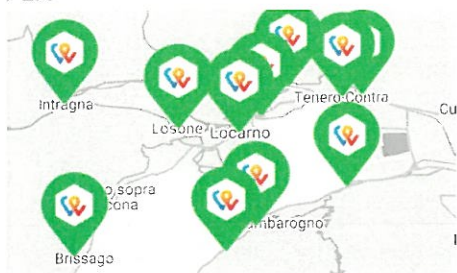
Figura 2: Locarnese