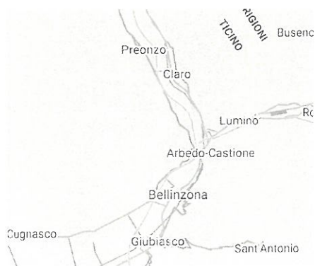
Figura 1: Bellinzone 1

Una città moderna si vede anche dalle piccole cose, che sono presenti in realtà vicine alla nostra. In comuni più piccoli si può ad esempio pagare le proprie soste, oltre che in contanti anche tramite sistemi e app quali parkinpay, easypark, epark 24 o TWINT. Con TWINT si può parcheggiare velocemente e in tutta comodità in circa 200'000 parcheggi di tutta la Svizzera, ma come si può vedere nell'immagine qui sotto nel comune di Bellinzona questa funzione non è ancora stata introdotta. Lugano e Locarno invece hanno già aderito a questo metodo di pagamento.