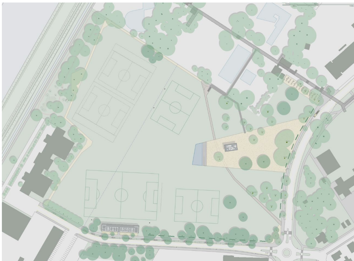
Il progetto del Parco urbano dell'arch. Bürgi – visione complessiva

All'idea di progetto sviluppato nel corso dell'autunno 2012 dall'arch. Bürgi, ha fatto seguito il Messaggio municipale n. 3782 del 20 novembre 2013 inerente alla realizzazione della tappa 1, approvato dal Consiglio comunale in data 24 febbraio 2014.