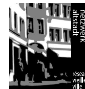
Analisi urbana Bellinzona Febbraio 2017