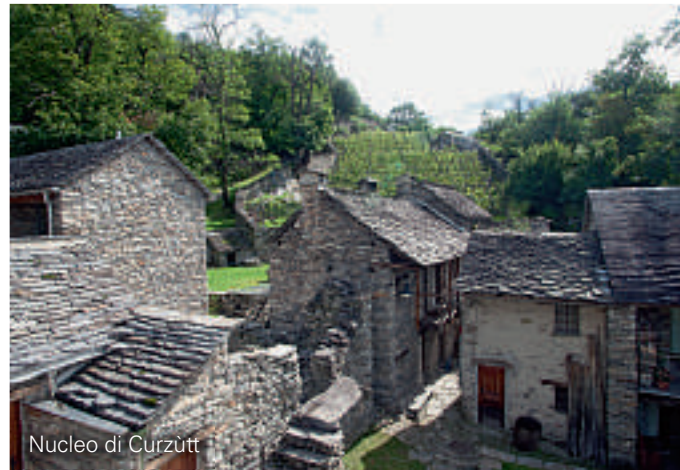
Nucleo di Curzùtt

La cartina riprodotta sul retro indica un itinerario architettonico che illustra gli interventi più significativi gestiti con i nuovi concetti pianificatori.