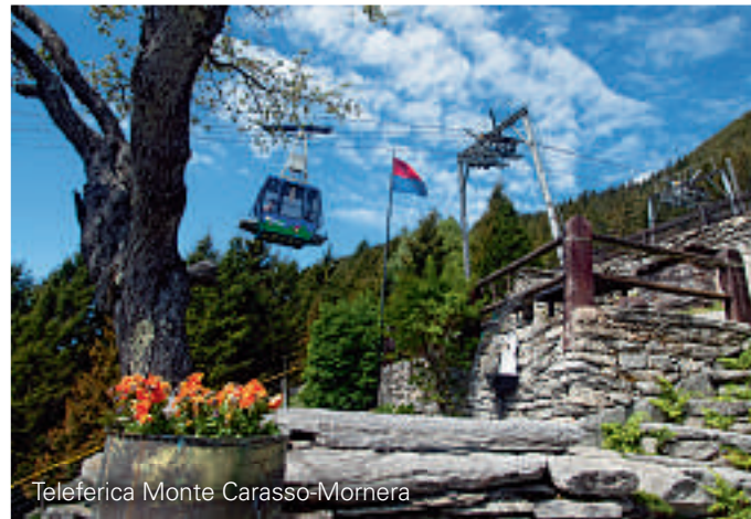
Teleferica Monte Carasso-Mornera

La situation géographique et la richesse du paysage de Mornera invitent à faire d'agréables promenades et excursions dans un cadre naturel propice à un rapprochement avec la nature par la découverte des traces indélébiles que l'homme a laissées sur son passage. Albagno est point de départ de nombreuses excursions, dont certaines sont difficiles. Le refuge (UTOE) Albagno, à 1870 m et comptant 28 places, est sans gardiennage et reste ouvert toute l'année.