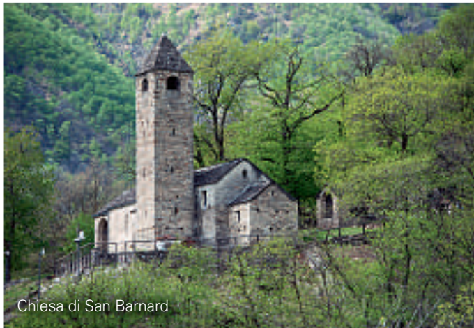
Chiesa di San Barnard

Bei der Bergstation Mornera laden die üppige Landschaft und Geografie zu angenehmen Spaziergängen und langen Wanderungen ein. Die entzückende Berglandschaft bringt Seele und Natur in Einklang. Dabei entdeckt man immer wieder die unauslöschlichen Spuren früher menschlicher Besiedelung. Albagno ist Ausgangspunkt für verschiedene, z.T. anspruchsvolle Wanderungen. Die Berghütte (UTOE) Albagno, 1870 m.ü.M. ist ganzjährig geöffnet, ohne Hüttenwart (28 Betten).