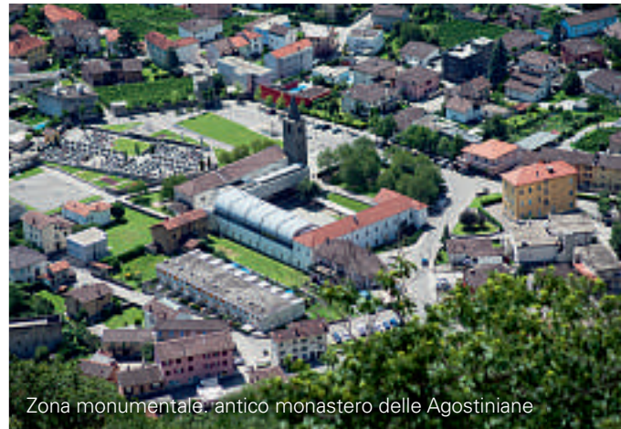
Zona monumentale: antico monastero delle Agostiniane

Giunti a Mornera, il ricco paesaggio e la geografia suggeriscono gradevoli passeggiate ed incantevoli escursioni all'interno di un paesaggio naturale che porta fatalmente lo spirito ad un riavvicinamento alla natura attraverso la scoperta delle indelebili tracce lasciate dal passaggio dell'uomo. Albagno rappresenta un punto focale da cui si snodano diverse possibilità escursionistiche (alcune delle quali impegnative). La capanna (UTOE) Albagno, 1870 m, è aperta tutto l'anno, senza guardiano, (28 posti letto).