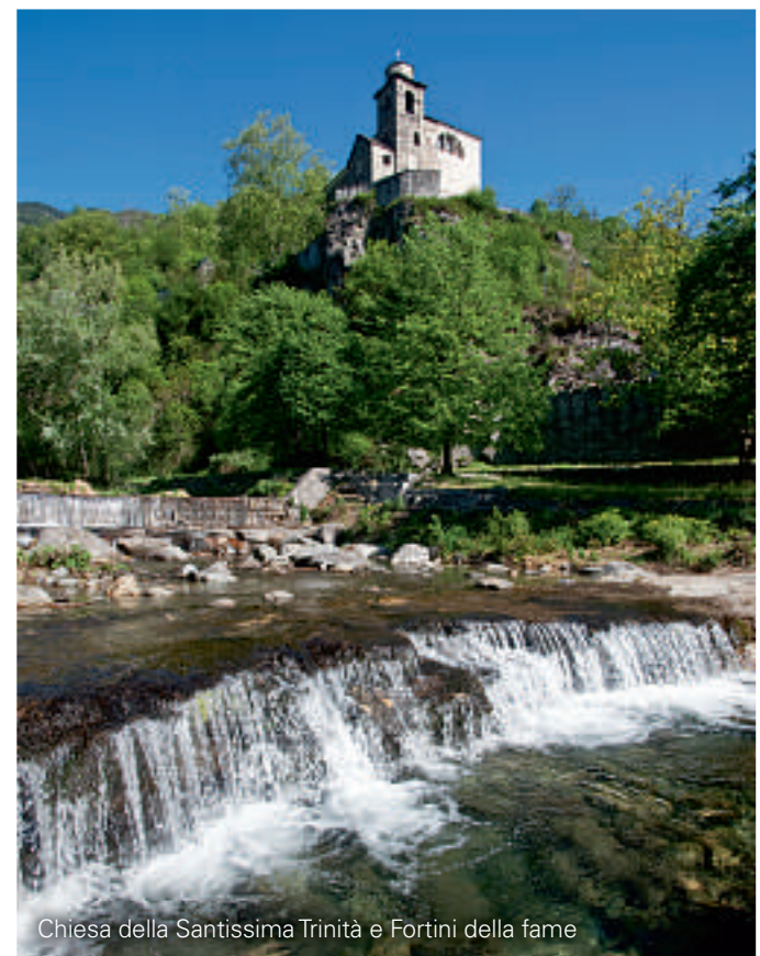
Chiesa della Santissima Trinità e Fortini della fame