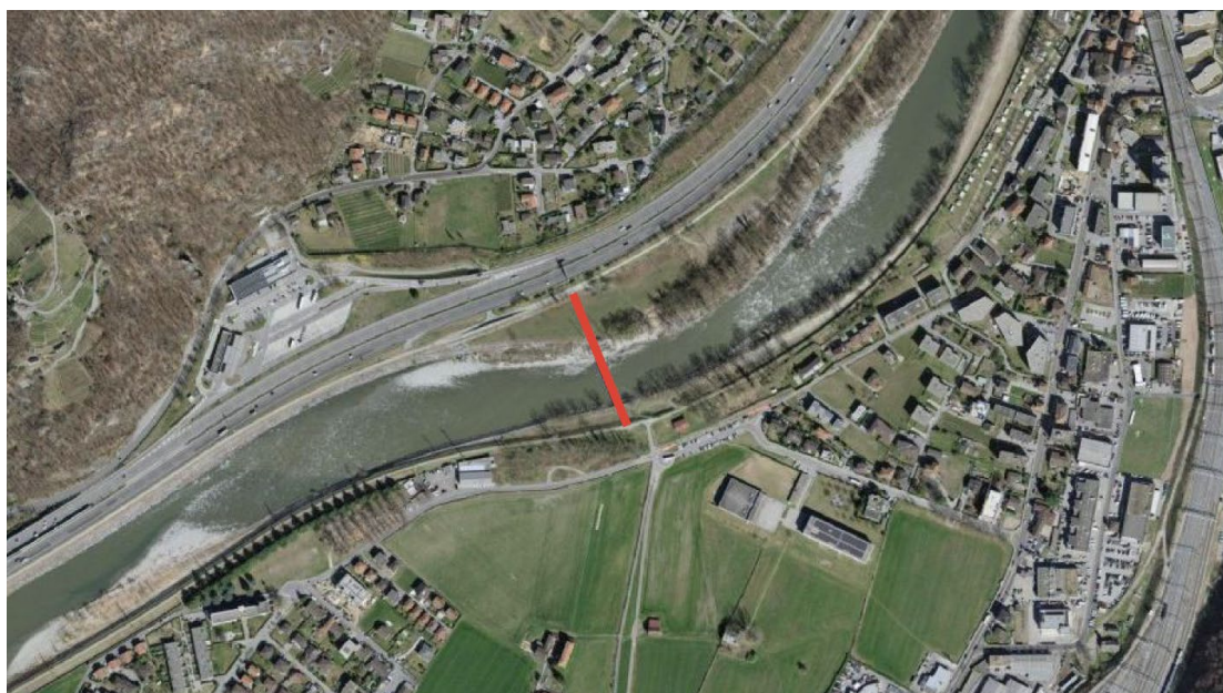
Figura 1 – Estratto planimetrico con evidenziato in rosso il manufatto

A oggi, purtroppo, il manufatto si presenta in uno stato di deterioramento che richiede un intervento di risanamento complessivo, necessario per garantirne la conservazione e l'utilizzo in sicurezza.