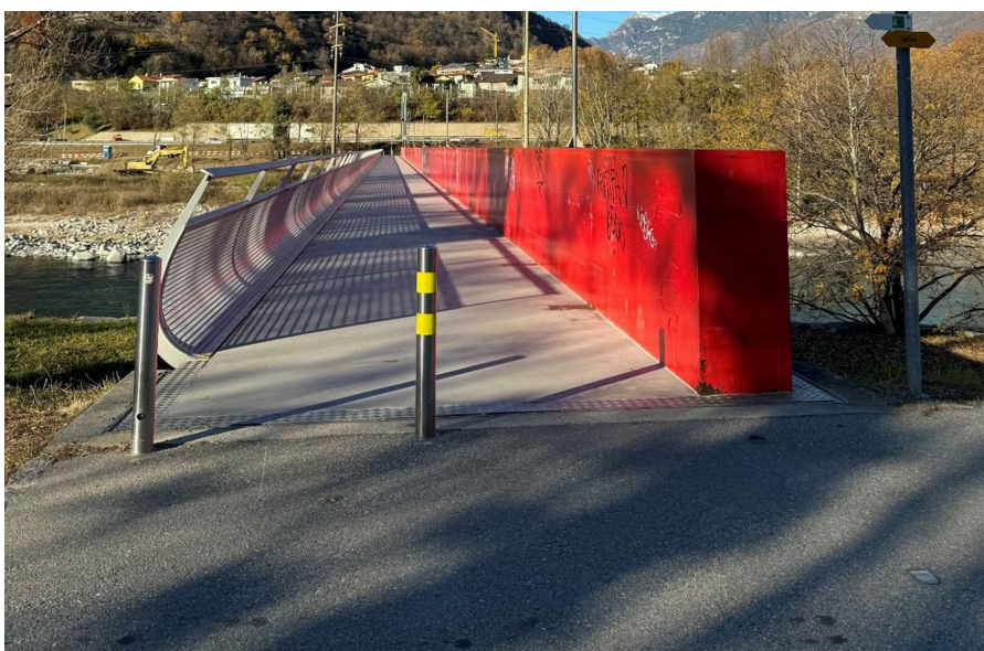
Figura 4 – Accesso alla passerella da Pratocarasso