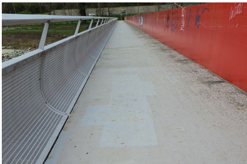
Figura 3 – Stato del manufatto dopo i lavori svolti nell'estate del 2024

A seguito dei primi approfondimenti tecnici effettuati, il Municipio, nell'estate del 2024, ha disposto un intervento urgente e mirato, necessario per impedire un ulteriore deterioramento dello stato del manufatto. Si è trattato di un intervento parziale, realizzato con criteri di urgenza e funzionalità. Nonostante l'aspetto poco gradevole, la priorità era quella di preservare la struttura in attesa di un risanamento completo. Senza questa misura temporanea, il degrado sarebbe progredito ulteriormente, generando costi ancora più elevati in futuro.