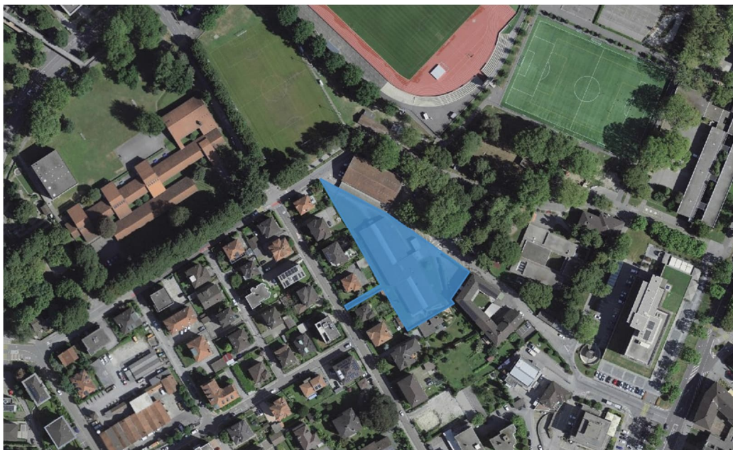
Figura 2 – Perimetro di intervento