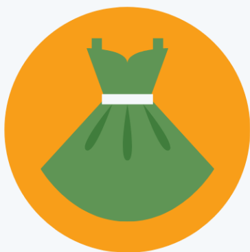
MODA E TESSILI